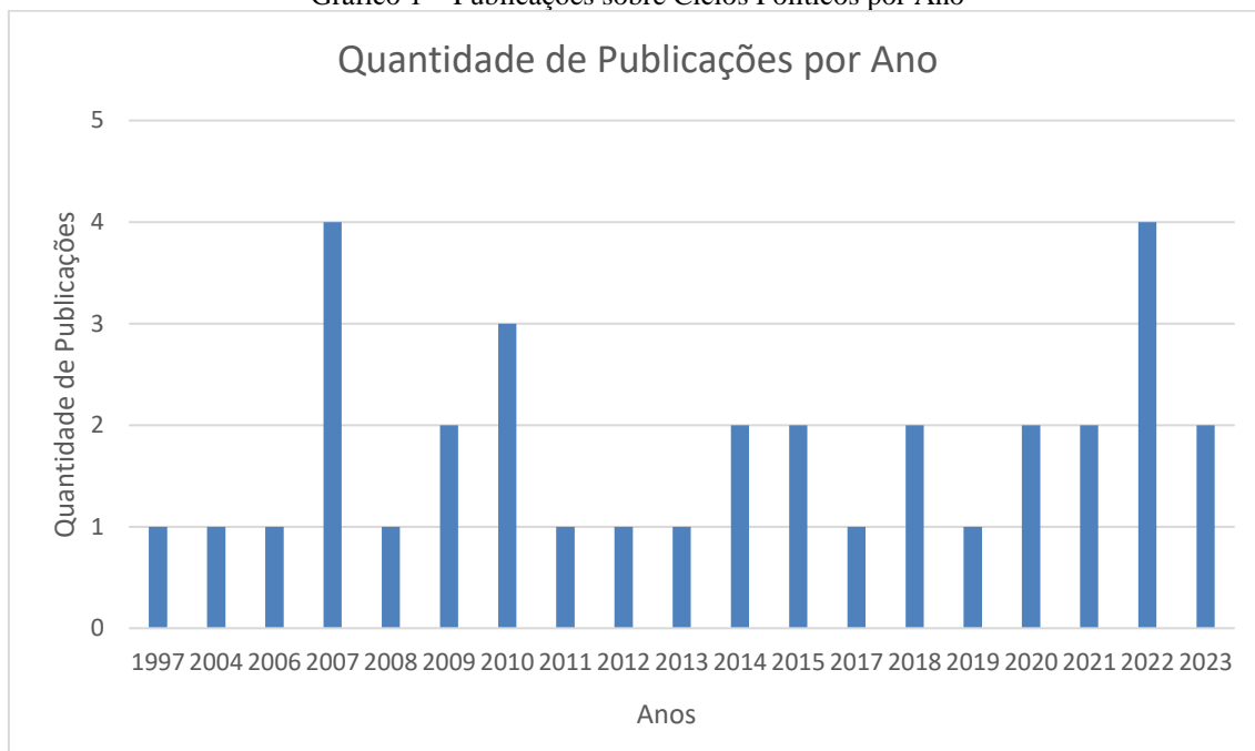
Gráfico 1 – Publicações sobre Ciclos Políticos por Ano